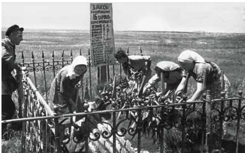
129 Kolchosbäuerinnen pflegen das Grab von 16 Artilleriesoldaten, Rostower Gebiet Februar 1942

■ Колхозницы ухаживают за могилой 16 артиллеристов, Ростовская область февраль 1942