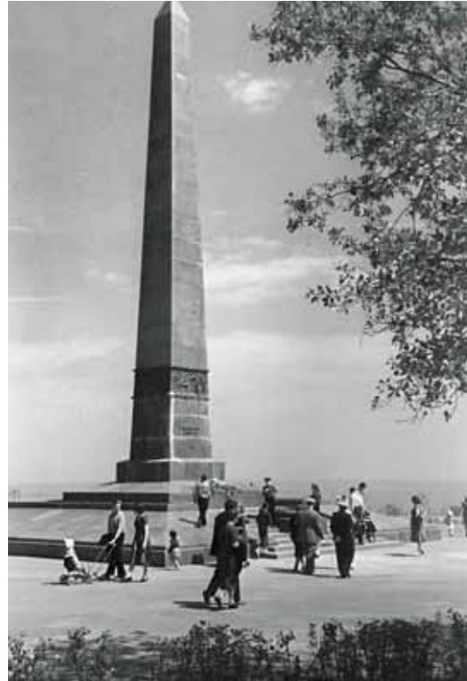
133 Grabmal des unbekanntenen Matrosen, Odessa 1963