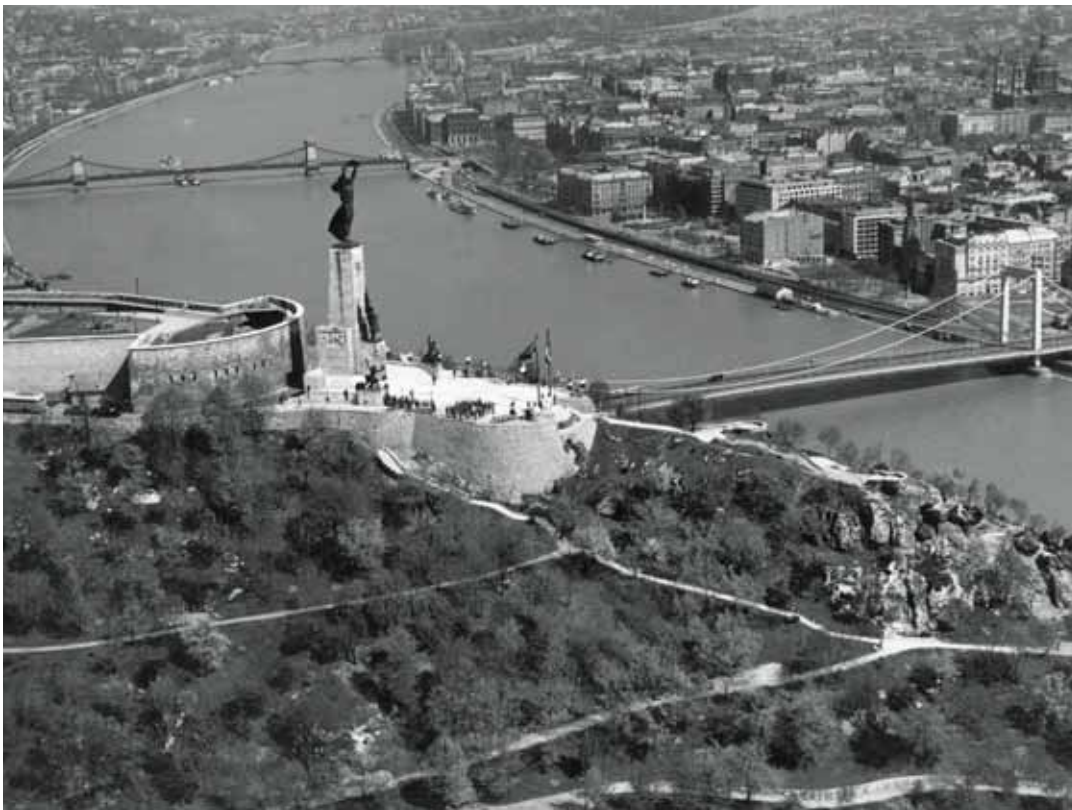
117 Denkmal für die sowjetischen Soldaten auf dem Gellertberg, Budapest o.D.