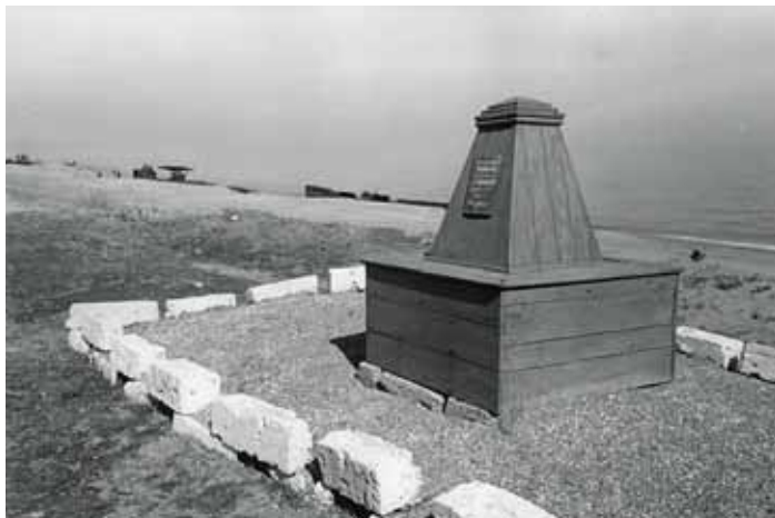
130 Denkmal zur Erinnerung an Gefallene, Krim o.J. (vor 1945)