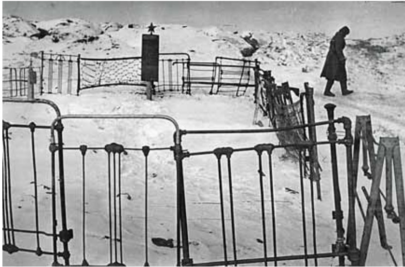
128 Provisorische Grabstätte für gefallene sowjetische Soldaten, Stalingrad 1942/43