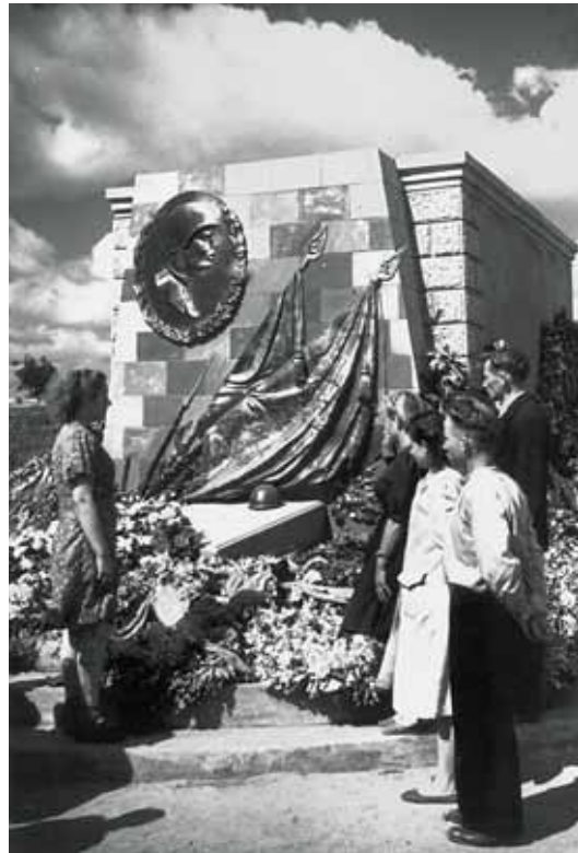
131 Denkmal und Grabstätte

Aleksandr Matwejewitsch Matrossows, Welikije Luki 1948