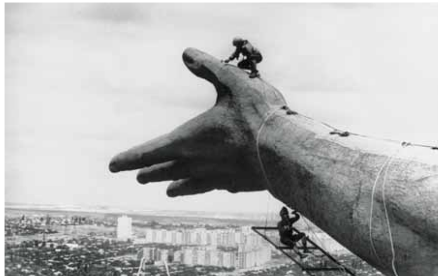
134 Reparaturarbeiten an der Statue der »Mutter Heimat«, Wolgograd o.D.

Уже в 1944 году в ходе восстановления Сталинграда были сделаны первые предложения соорудить монументальный памятник. В конце 1951 года скульптор Евгений Вучетич, автор памятника в Трептов-парке в Берлине, выполнил первый проект. В 1957 году Хрущев вернулся к рассмотрению предложений Вучетича с намерением реализовать их. Вследствие решения спорных вопросов строительство затянулось на восемь лет. Гигантский мемориальный комплекс на Мамаевом кургане был открыт 15 октября 1967 г., через три года после смещения Хрущева. В центре ансамбля стоит 85-метровая скульптура «Родина-мать зовет!» Эта монументальная скульптура, которую в 60-е годы критиковали за подчеркивающую тело одежду и невоенную девичью внешность, стала самым известным символом победоносной борьбы.