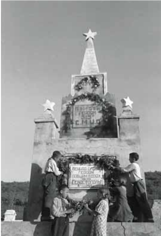
132 Denkmal zur Erinnerung an die im Kampf um Sewastopol gefallenen sowjetischen Soldaten, Sewastopol Mai 1944